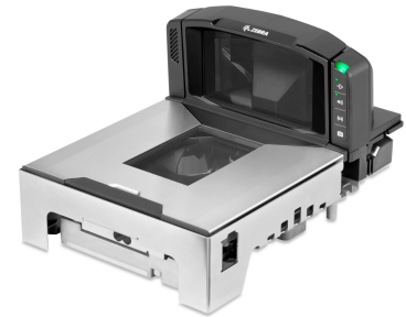
CS 300 MP 70

Der Grundpreis – wahlweise mit oder ohne Tarawert – wird von der Kasse an die Waage übertragen, die auf Basis des ermittelten Gewichts den Verkaufspreis errechnet. Zahlreiche Schnittstellen zu den gängigen Kassensystemen stehen im Standard zur Verfügung. Wahlweise kann zwischen einem Software-Display oder einem Hardware- Display gewählt werden. Die Bedientasten für das Nullstellen und das Öffnen des Waagenmenüs sind in den Scanner integriert und ermöglichen bei Nutzung des Software-Displays einen besonders kompakten und aufgeräumten Kassenarbeitsplatz.